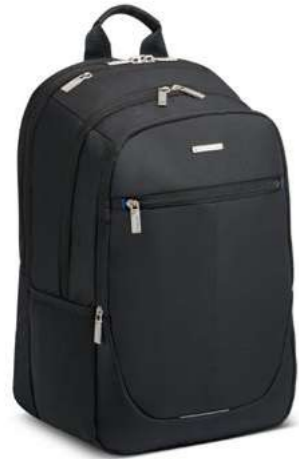
Codi 68965A / B ZAINO PORTA PC 2 COMPARTI (PC 15.6") LAPTOP BACKPACK 2 COMPART. (LAPTOP 15.6")

dimensioni cm 44 x 30 x 20 dimensions inch 17.32 x 11.81 x 7.87 peso weight kg 0.6