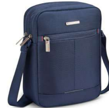
Codi 68966A / B BORSELLO GRANDE 2 COMP. (TABLET 10") LARGE CROSSBODY WITH 2 COMP. (TABLET 10")

dimensioni cm 25 x 20.5 x 6 dimensions inch 9.84 x 8.07 x 2.36