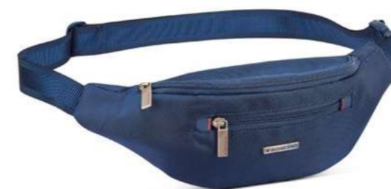
412728 MARSUPIO BUM BAG

dimensioni cm 13 x 36 x 7.5 dimensions inch 5.11 x 14.17 x 2.95