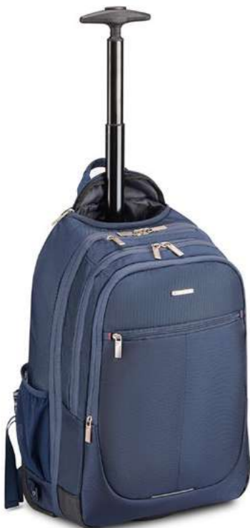
412725 ZAINO TROLLEY (PC 17.3") BACKPACK TROLLEY (LAPTOP 17.3")

dimensioni cm 48 x 32 x 20 dimensions inch 18.90 x 12.60 x 7.87 peso weight kg 2.2