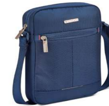
Codi 68967A / B BORSELLO 1 COMP. CROSSBODY 1 COMP.

dimensioni cm 22.5 x 19 x 4 dimensions inch 8.85 x 7.48 x 1.57