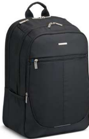
412721 ZAINO PORTA PC 2 COMPARTI (PC 17.3") LAPTOP BACKPACK 2 COMPART. (LAPTOP 17.3")

dimensioni cm 48 x 32 x 20.5 dimensions inch 18.90 x 12.60 x 8.07 peso weight kg 0.7